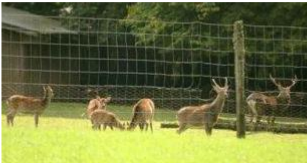
Les Cerfs Sika en allant à Verrières du Grosbois