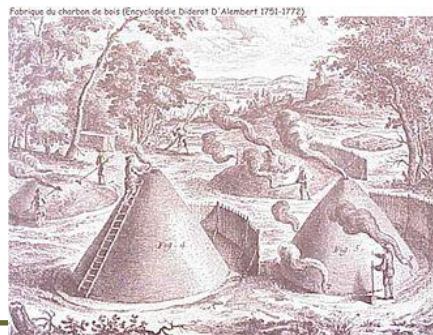
Fabrication du charbon de bois (Encyclopédie Diderot D'Alembert 1751-1772)

Le village compte 4 logements communaux, une école, une salle des fêtes.