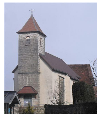
L'église de Charbonnières les Sapins

La Fromagerie a été en activité jusqu'en 1990, l'épicerie a existé jusqu'en 1938 et le café jusqu'en 1978.