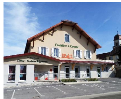
La Fruitière d'Étalans

Commerces : Étalans accueille deux salons de coiffures, l'entreprise de matériaux Vieille, un dépôt de pain, un commerce de proximité, un électricien, deux garages de réparation de voitures, une entreprise de location de véhicules et une société de vente et location de remorques. S'y ajoutent la ZA de la Croix de Pierre et le restaurant du champ de foire.