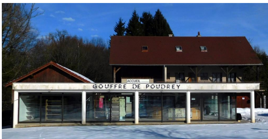
L'entrée du Gouffre de Poudrey