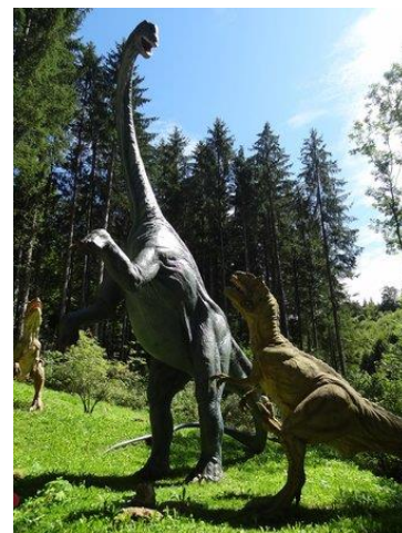
Le DINO ZOO