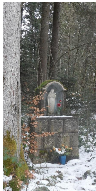
Petite Vierge à Verrières du Grosbois

Le village souhaite s'agrandir et accueillir de nouveaux habitants.